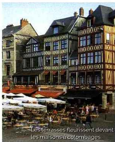
Les terrasses fleurissent devant les maisons à colombages.

Œuvre de l'artiste allemand Yadegar Asisi, l'énorme silo de toile bleue ressuscite l'art du panorama, très populaire aux xviii e et xix e siècles. D'immenses toiles peintes tendues étaient vues à 360°. Le Panorama XXL permet de patienter