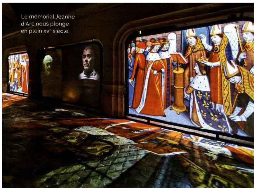
Le mémorial Jeanne d'Arc nous plonge en plein xv e siècle.

teau d'eau-marégraphe du xix e siècle, quai de Boisguilbert, édifice destiné à actionner les grues hydrauliques du port, ainsi qu'à mesurer le niveau de l'eau au rythme des marées. Mémoire de l'activité industrielle fluviale, les anciens hangars à charbon ou à céréales se sont mués en restaurants, bars, salles de concerts (dont le célèbre 106). Tous tournés vers les méandres du fleuve et le pont levant Flaubert, qui permet à l'Armada de voiliers et de navires de remonter la Seine tous les cinq ans (en 2019 maintenant). Une croisière est d'ailleurs envisageable et l'on peut même, c'est bien tentant, rejoindre la côte d'Albâtre depuis Rouen. ■