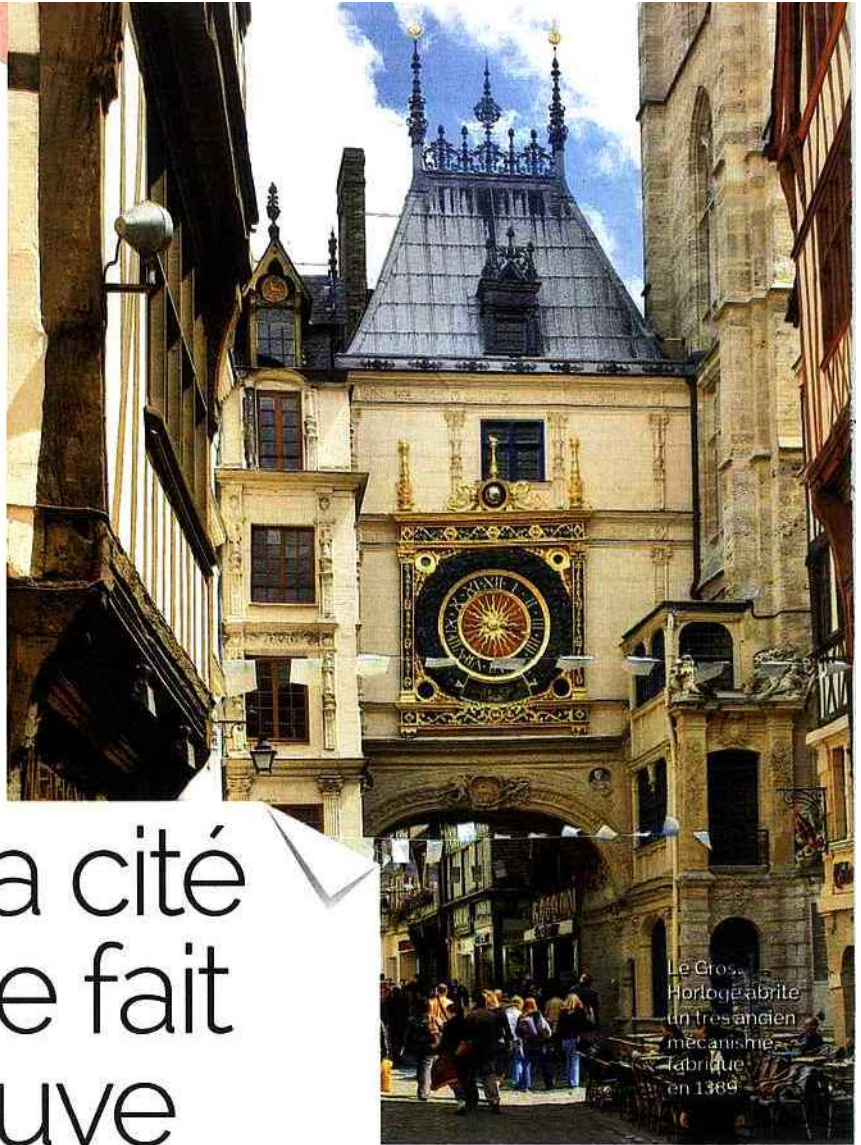
Le Gros Horloge abrite un tresandien mécanisme fabriqué en 1384